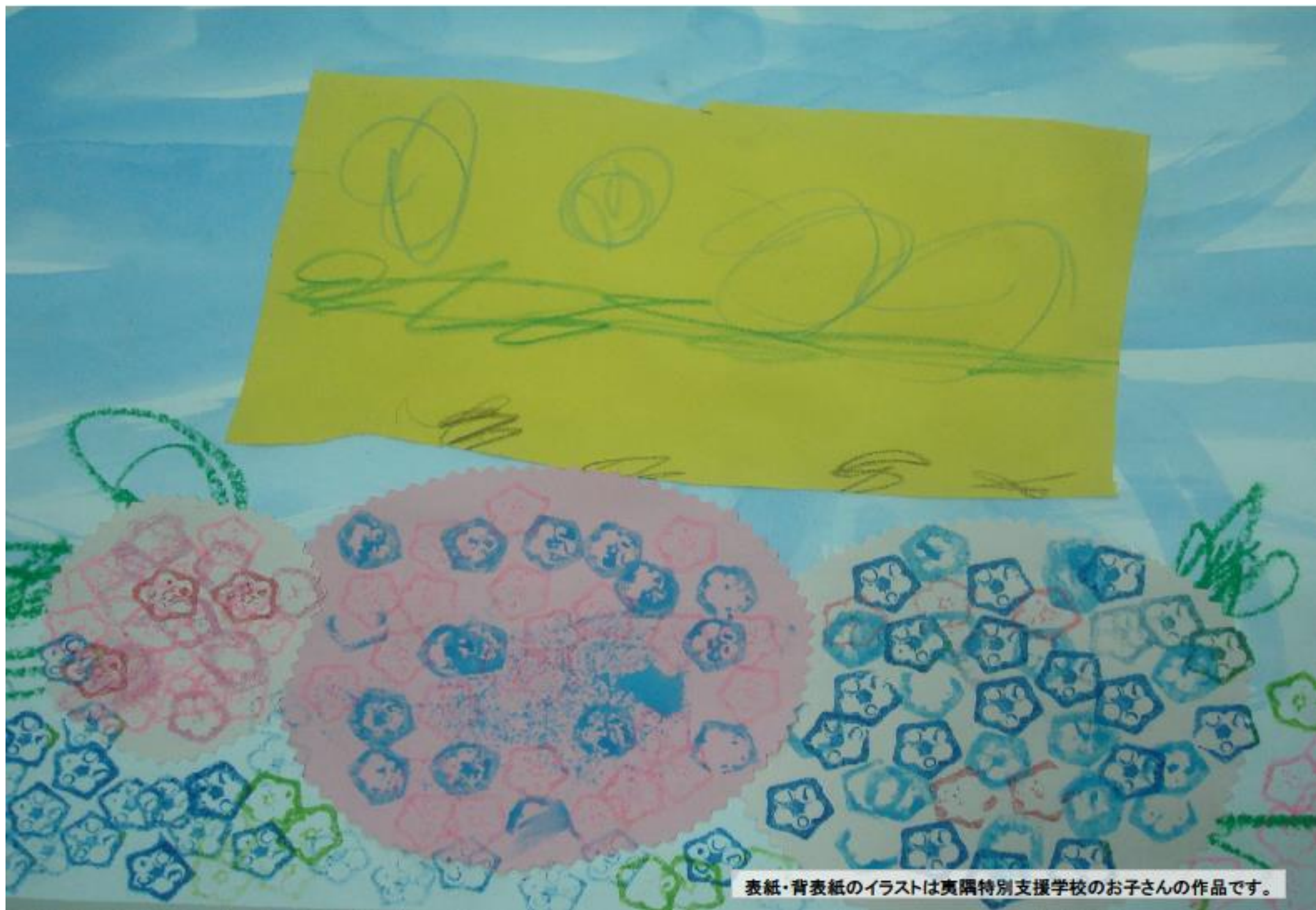
表紙・背表紙のイラストは夷隅特別支援学校のお子さんの作品です。