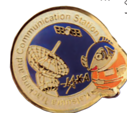
勝浦宇宙通信所のオリジナルキャラクター「カッキーくん」

…と、飯島さんに説明を受けたものの、衛星と言われると、はるか遠い世界の出来事のようにも思えてしまう。だが、超高速インターネット衛星「きずな」の展示模型を前にして「東日本大震災の際、きずなから電波を送って、被災地でインターネットが使えるようにしたんですよ」と教えてもらおうと、ぐっと親近感が湧いてきた。水循環変動観測衛星「しずく」は台風予測に、陸域観測技