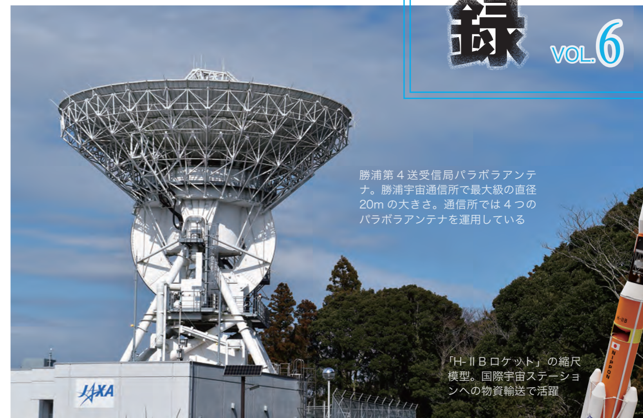
勝浦第 4 送受信局パラボラアンテナ。勝浦宇宙通信所で最大級の直径 20m の大きさ。通信所では 4 つのパラボラアンテナを運用している

国道 297 号線の松野交差点辺りから見える、 尾根の上にそびえる真白なパラボラアンテナ。 これは人工衛星の追跡、管制を行う、 ジャクサ JAXA 勝浦宇宙通信所のアンテナなのだ。 また、開設 50 周年を迎えた勝浦宇宙通信所は、 実は展示室の見学ができる 宇宙ファンにはたまらないスポットでもある!!