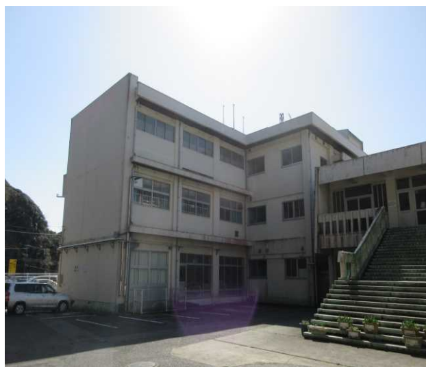
②A棟(管理・特別教室棟)北側