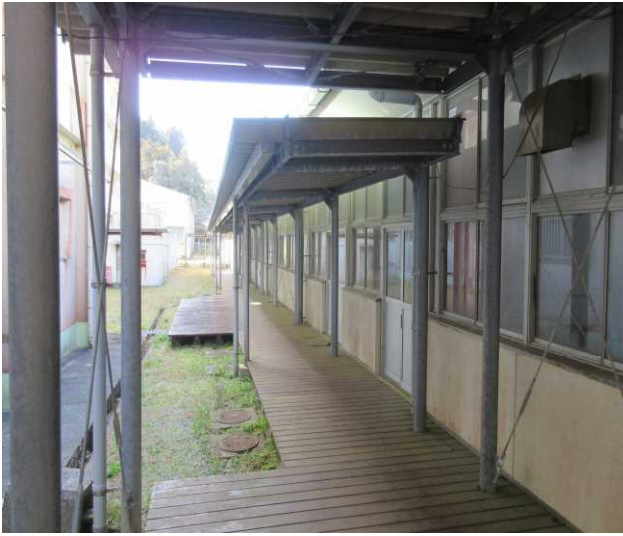
⑦D棟（小講堂・実習室）東側