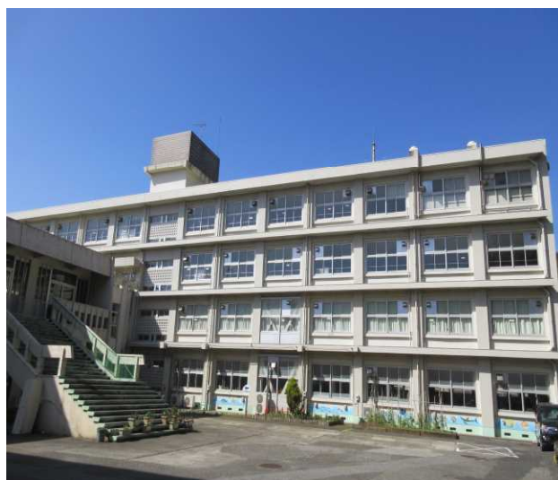
④B棟(普通・特別教室棟)東側