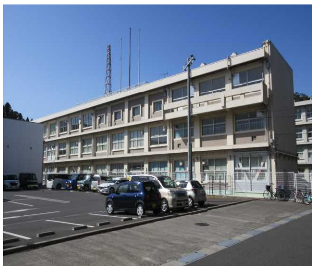
①A棟(管理・特別教室棟)南側