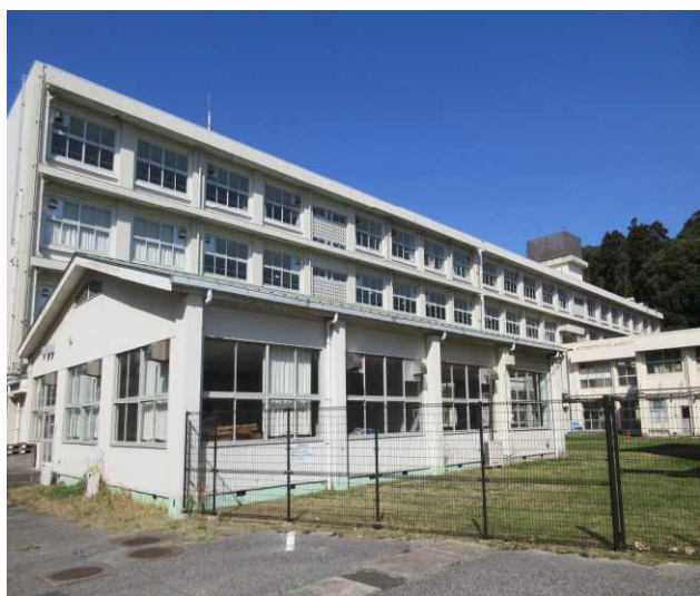
⑤B棟(普通・特別教室棟)西側