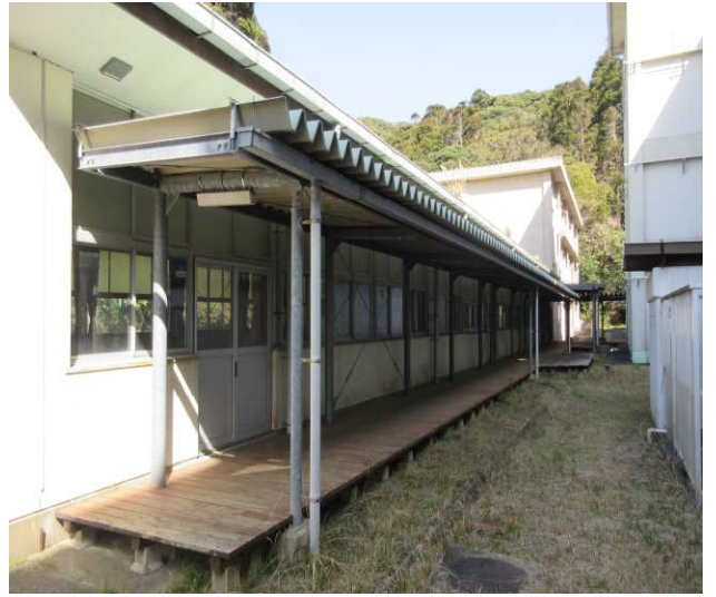
⑧D棟（小講堂・実習室）西側