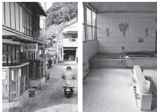
右) 男湯の浴室。実はジェットバスもある 左) 車1台がやっと通れるような路地裏にある松の湯

たちだった。「北海道から九州まで、方言が飛び交ってましたよ。船乗りさん、よく腹巻をしていましたね。腹巻に札束を挟み込んでから(貴重品として) 預かるの。だから番台から下りられないのよ。どうしても用を足さなきゃいけない時は交代して。食事は戸棚に頭を突っ込んだまま立ち食い。忙しかつたけど、魚をバケツにいっぱいくれることもあったね。懐かしいね」