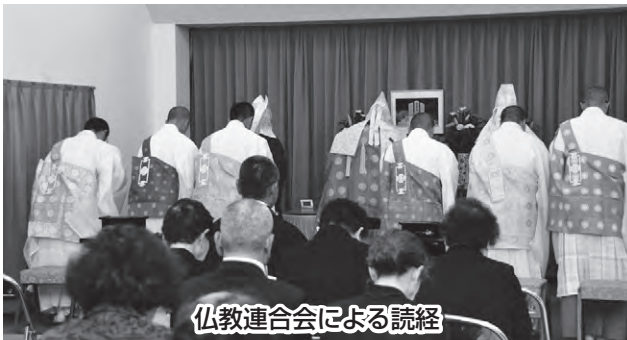
仏教連合会による読経

5月17日、戦没者を慰霊するために、新たに建立された忠霊塔の除幕式と慰霊式が行われました。