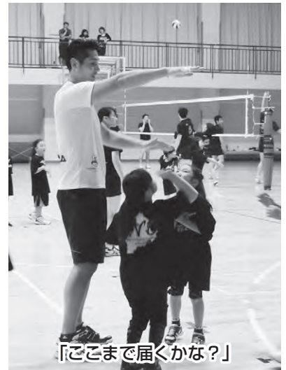
「どこまで届くかな？」

KVCは、国際武道大学協力のもと、バレーボールの競技活性化や生涯スポーツとしての定着を図るとともに、バレーボールを通じて、子どもから大人まで幅広い世代が交流する、活気ある地域づくりをめざしています。