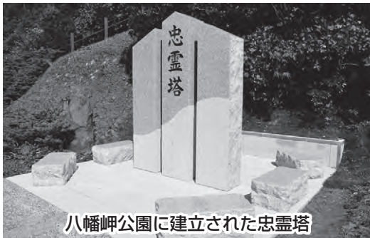
八幡岬公園に建立された忠霊塔

忠霊塔は、昭和30年から覚翁寺内の山頂に建立されていましたが、60余年の歳月とともに老朽化が進んでしまったため、今回、八幡岬公園内への新設となりました。