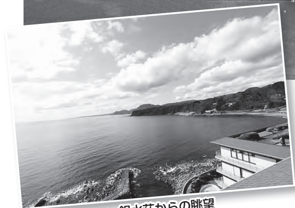
銀水荘からの眺望