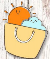
勝浦中央商店会 ハンドメイド楽市 ガチャガチャ企画