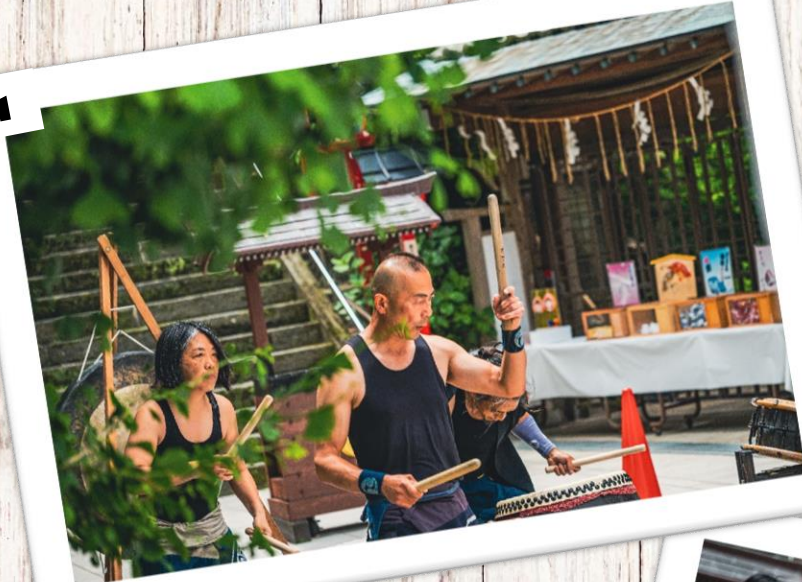
1 yoluca 和太鼓演奏・演舞