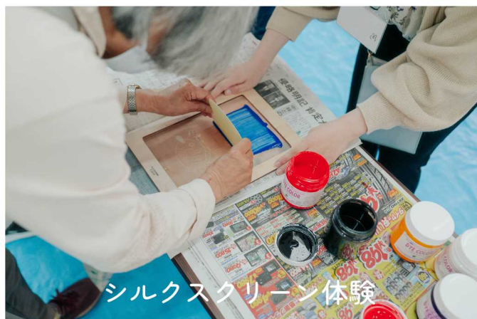
シルクスクリーン体験