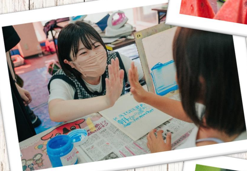
和洋女子大学文化芸術専攻 シルクスクリーン体験