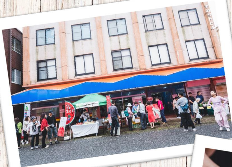
富里市 スイカ・農産物出張販売