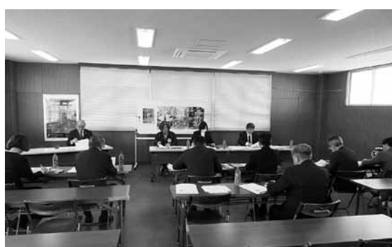
2月10日 青森県八戸市議会 会派 きずなクラブ 視察内容：朝市の活性化について 朝市を中心とした観光について 勝浦市の観光施策について