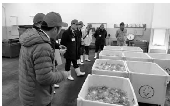
1月22日 静岡県西伊豆町議会 第2常任委員会 視察内容：勝浦漁港、かつうら朝市 勝浦宇宙通信所現地視察

本市議会では、今後もこうした交流を通じて地域の魅力を発信するとともに、全国の好事例を学び、より良いまちづくりに努めてまいります。