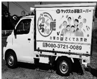
ヤックス移動販売