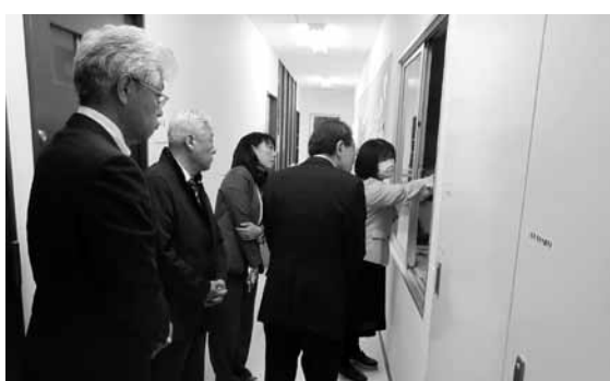
2月9日 宮城県柴田町議会 会派 幸政会 視察内容：小中学校の学校給食について