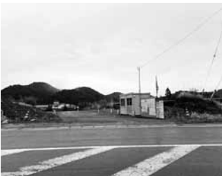
松野バイパス (1工区)

Q 各分野における明るい兆しについてお伺いします。 A 廃棄物処理に関する事業の進展、磯焼け対策における勝浦市藻場保全対策協議会の発足、3地区の土地改良事業の推進、国道297号松野バイパスの1工区の橋りょうの下部工事及び工事用道路施工が進められており、今後引き続き各事業の推進に努めてまいります。