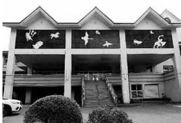
旧総野小学校玄関

A 学習支援では、WiFi環境の無い家庭にモバイルルーターの貸与。また、スクールバス運行・定期代の補助等があります。