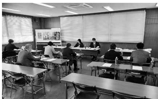
1月27日 静岡県沼津市議会 会派 志政会 視察内容：空き校舎活用対策事業について